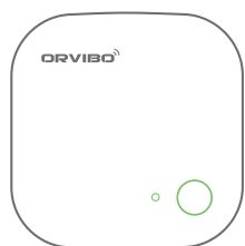
Zigbee Mini Hub x1